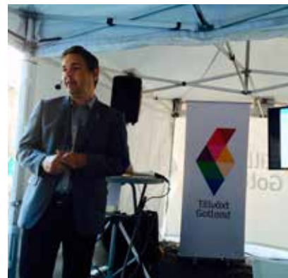
Vi började varje dag under Almedalsveckan med ett seminarium.

Under året gör vi ett stort antal arenor där företag, organisationer och det offentliga kan träffas. Den största arenan är Företagardagen som arrangeras av oss varje höst. Arenan är en plats för inspiration med olika föreläsningar och seminarier. Det är också en plats där vi hyllar näringslivet och tjänstemän för deras insatser under året. Ett tiotal priser delas ut under galamiddagen på kvällen.