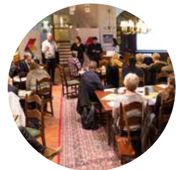
Frukostmöten arrangeras varannan månad på Strand Hotell.

Föreningen är också med och planerar Region Gotlands näringslivsfrukostar i samverkan med övriga näringslivsorganisationer.