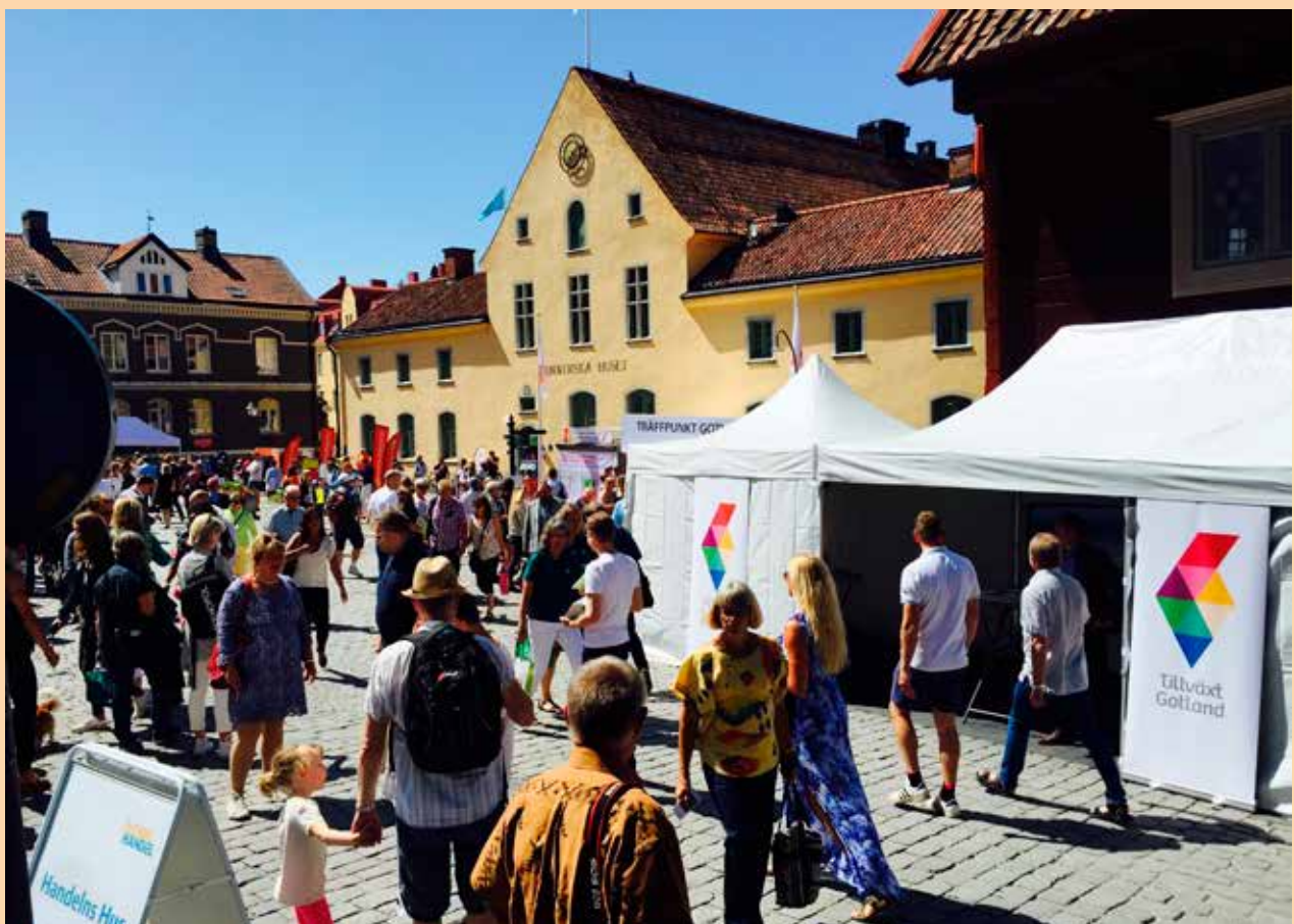
Tillväxt Gotland är med under Almedasveckan och visar det gotländska näringslivet.